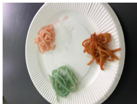
色変わり焼きそば作り

その他にも、ブタの眼解剖・炎色反応実験・化学発光実験・草木染め・透明骨格標本作り・天気図を書く ボルボックスの観察 など多種多様な活動をしています。